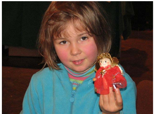
Ist mein Engel nicht süß?