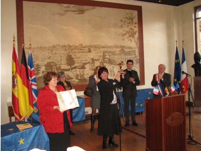
Überreichung der goldenen Sterne aus Brüssel