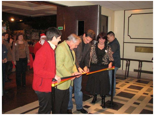
Die feierliche Eröffnung