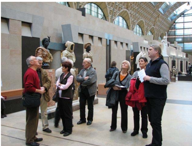
...im Musée d'Orsay