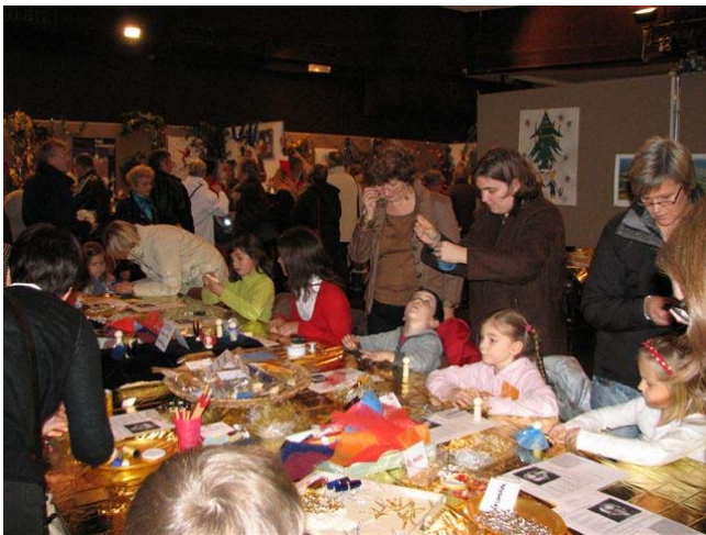
Der Basteltisch ist immer dicht Umlagert