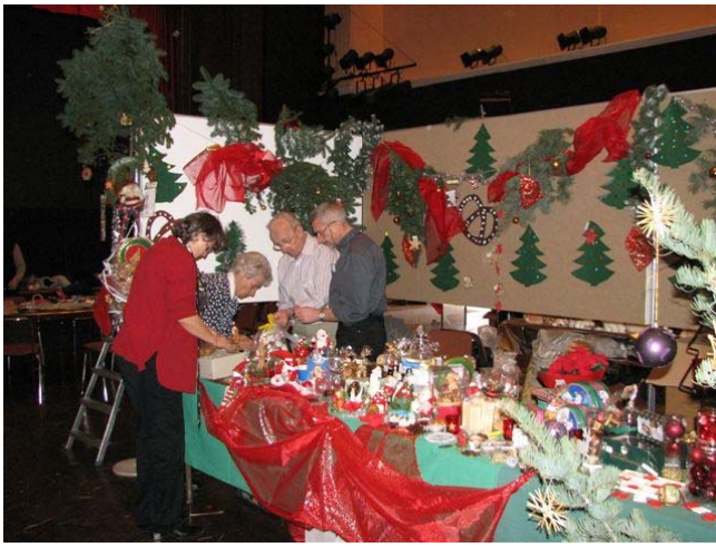
Der deutsche Stand- die letzten Vorbereitungen