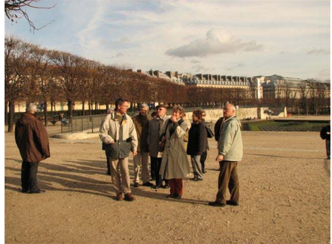
Das Weihnachtsmarkt-Team unterwegs in Paris