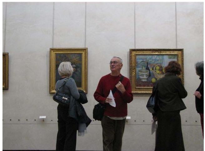
...unter fachkundiger Führung