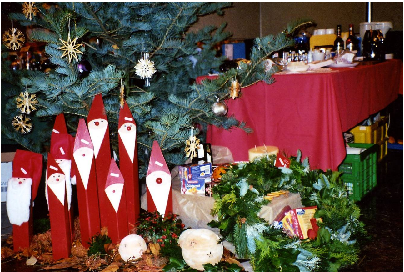
Zwischen unsere beiden Stände platzierten wir den Tannenbaum und die Wichtelgruppe. In der Bildmitte unser improvisierter Essensstand, an dem Ursula Stirnberg Stollen und Fruchtbrot anbot.