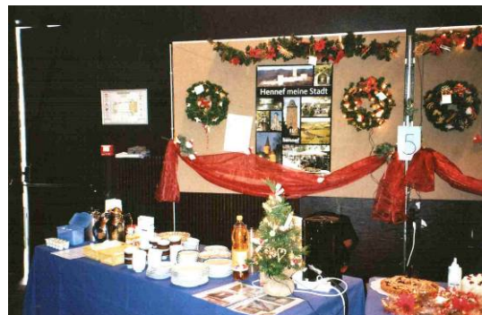
Deutscher Kuchen und deutscher Kaffee - auch in Le Pecq gefragt.