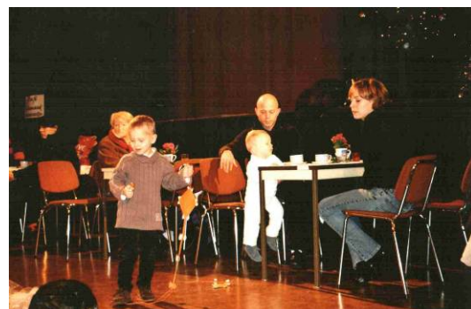
Café Allemand: Anfangs Ruhe, später Hochbetrieb